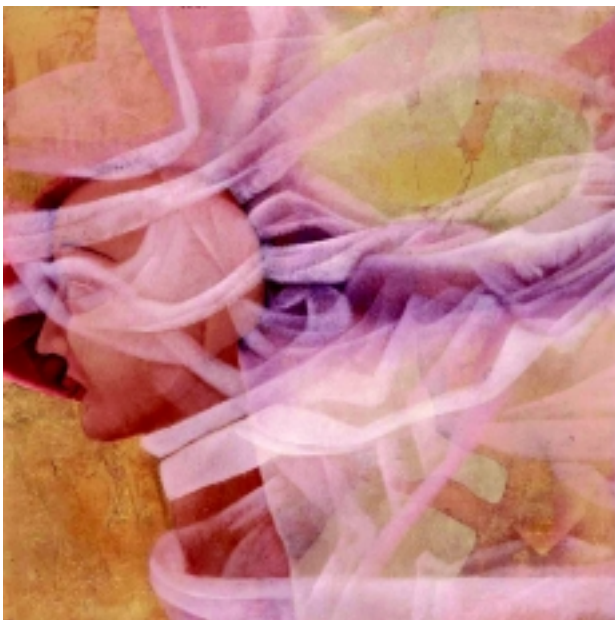
Requiem pour mes cheveux, huile sur toile, 45X45 cm, 2002