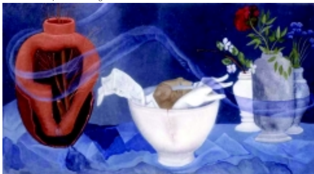
Nature morte pour la main gauche, huile sur toile, 50X90 cm, 2002

Tout commence dans une salle voûtée comme une cathédrale dans une intense lumière rouge. Elle voit un cheval chargé de branches qui s'enfuit, deux de ses habituels symboles picturaux et plus bas un lac et des bateaux en feu. Puis progressivement, le rouge devient vert et enfin bleu, splendide, dans un grand calme retrouvé. Elle est là, étendue au bord de ce lac avec d'autres personnes et tous semblent attendre le moment où ils seront aspirés vers la source de cette étonnante lumière bleue. Et soudain, le réveil, le retour à la vie, à l'hôpital avec cette ferme volonté de transformer ces lumières en couleurs.