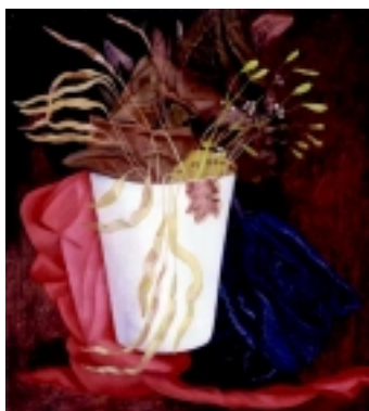
Le chou rouge oublié, huile sur toile, 53X47 cm, 2001