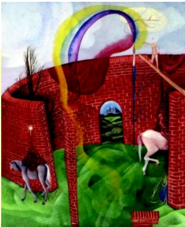
Petit château de sable, huile sur toile, 87X54 cm, 2002

Sonya Rosalia Bauters s'inscrit dans le lignage des surréalistes belges, une poétique de l'espace et de l'objet détourné investi de sens et de sensualité. Le mur de brique,