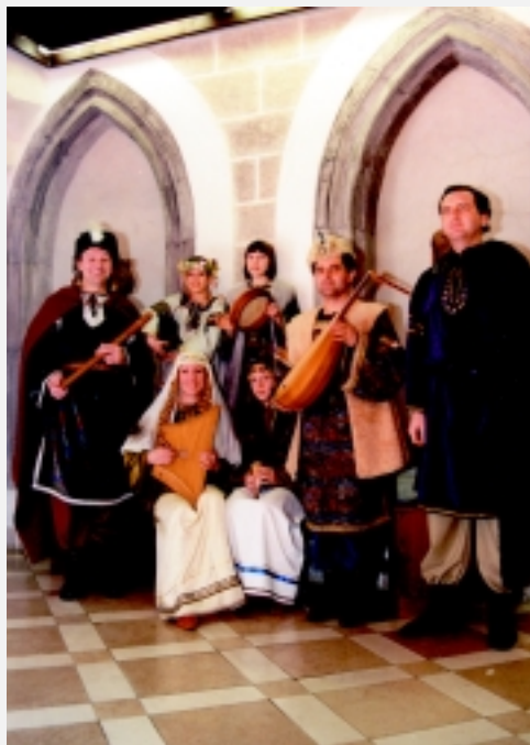
Ensemble Musicalina - Suisse