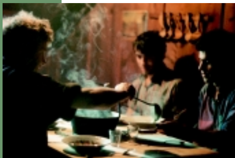
«Repas des armaillis dans un chalet d'alpage en Gruyère»