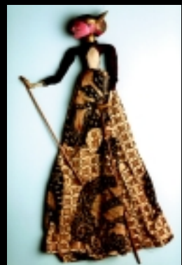
Figurine de théâtre Java central - 19e siècle Collection MPV